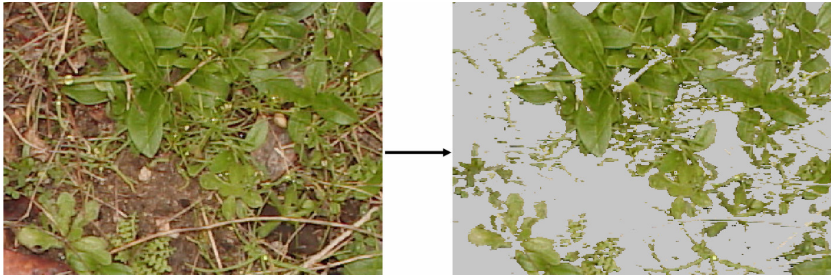
Figura 1. Separación de verdes en una imagen digital aplicando el índice RG con un umbral de 4. La cobertura del herbazal en la foto es de un 50,4%.